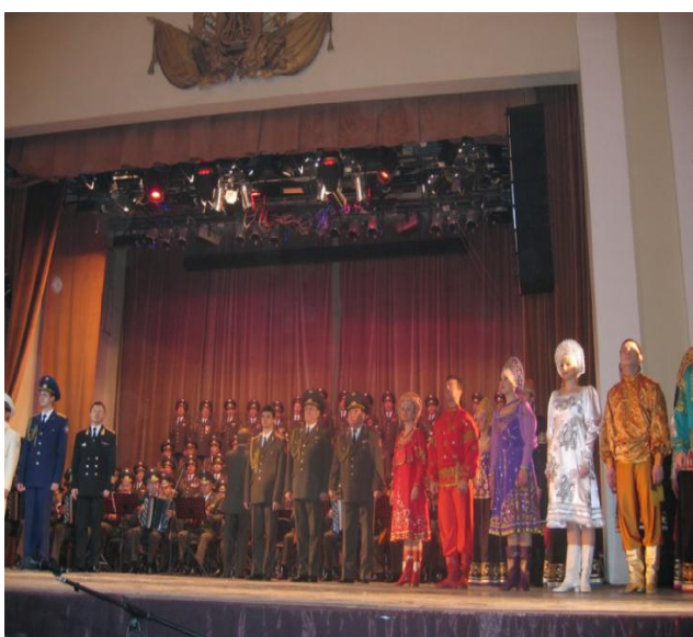
Выступление Ансамбля Александрова