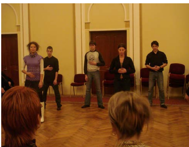
Мастер-класс по технике речи