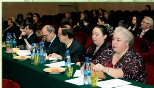
Первый всероссийский фестиваль-конкурс вокальных и речевых педагогов (13–14 марта 2010 г.). Прослушивание конкурсантов в номинации «Профессиональное вокальное образование»

Заметным мероприятием чётного года является второй (очный) тур Всероссийского фестиваля-конкурса вокальных и речевых педагогов (заочный тур проводится в нечётном году), направленного на повышение уровня квалификации педагогических кадров, передаче передового опыта, интересных методик,