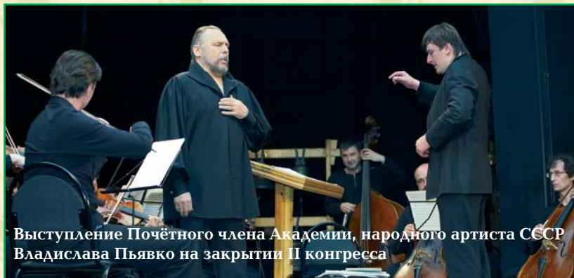
Выступление Почётного члена Академии, народного артиста СССР Владислава Пьявко на закрытии II конгресса

планарно, тем самым обогащая междисциплинарный багаж знаний специалистов. В рамках Конгресса проходят и узкоспециальные конференции — по фонии и педагогике.