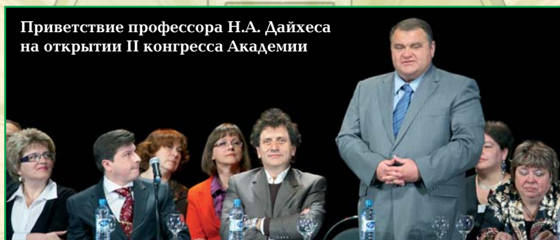
Приветствие профессора Н.А. Дайхеса на открытии II конгресса Академии