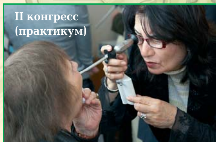
II конгресс (практикум)

главным научным мероприятием Академии, который проходит по нечётным годам. Его главным отличием от подобных зарубежных мероприятий является то, что на нём большинство научно-практических мероприятий проходят