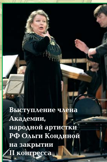
Выступление члена Академии, народной артистки РФ Ольги Кондиной на закрытии II конгресса

главным научным мероприятием Академии, который проходит по нечётным годам. Его главным отличием от подобных зарубежных мероприятий является то, что на нём большинство научно-практических мероприятий проходят