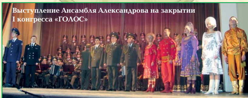
Выступление Ансамбля Александрова на закрытии I конгресса «ГОЛОС»