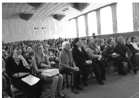
Участники конкурса-практикума в г. Великие Луки