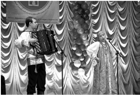
Участники гала концерта