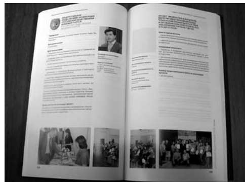
Информация об Академии в каталоге