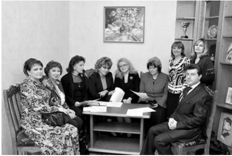
Организаторы конкурса-практикума на рабочем совещании