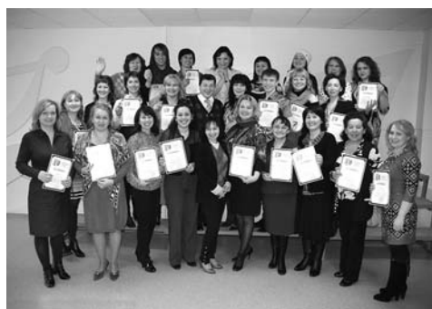
Участники семинаров в г. Альметьевске

Главными направлениями в ходе реализации проекта были просветительская деятельность в Субъектах РФ на межрегиональных мероприятиях Академии, формирование акустической лаборатории, научно-исследовательская деятельность по изучению акустических параметров голоса при хронических заболеваниях гортани у детей и подростков, которые можно отнести к предраковым, как способ ранней профилактики онкологической патологии.