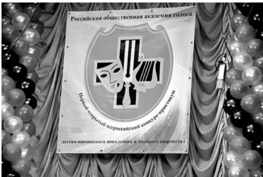
Эмблема организатора конкурса-практикума — Российской общественной академии голоса

Принципиально новой возможностью явилось участие в конкурсной программе детей и подростков, занимающихся чтецким и актёрским видами искусства. Соответственно и педагоги данных направлений имели возможность показать достижения своих учеников.