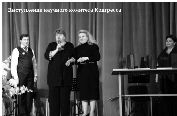
Выступление научного комитета Конгресса