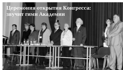
Церемония открытия Конгресса: звучит гимн Академии