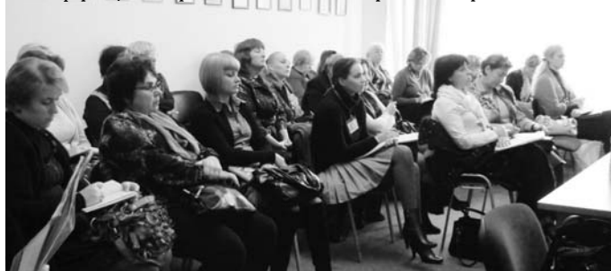
Конференция по проблемам вокального и речевого образования