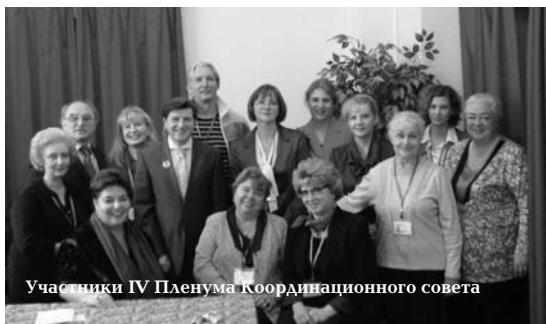
Участники IV Пленума Координационного совета