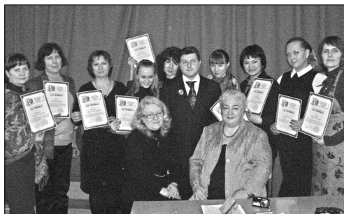
Фото 7. Закрытие курсов.