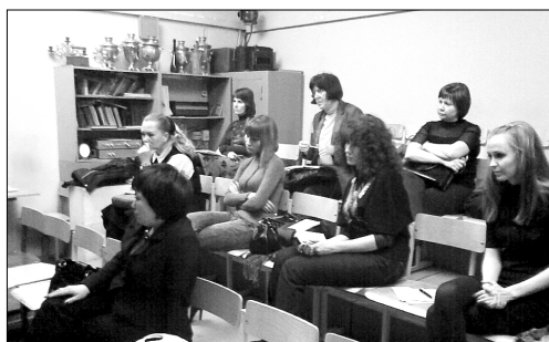
Фото 1. Участники курсов.