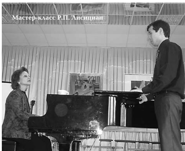
Мастер-класс Р.П. Лисициан