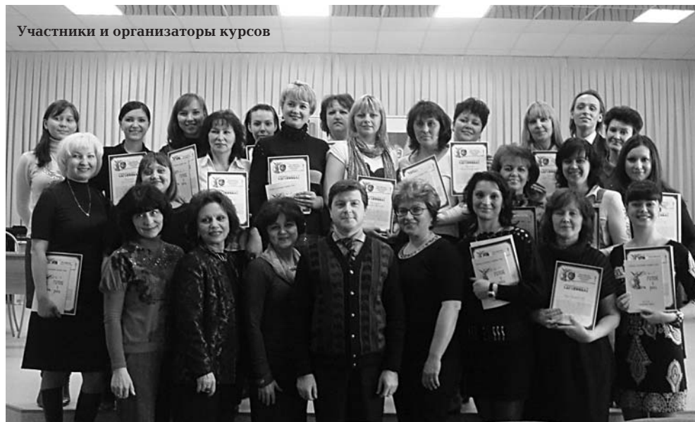
Участники и организаторы курсов