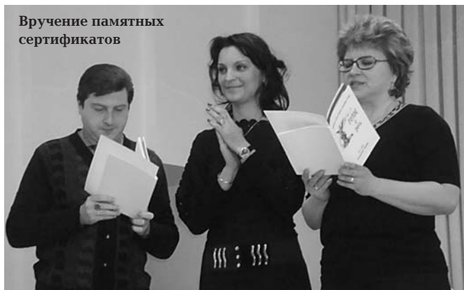
Вручение памятных сертификатов

памятные сертификаты от Российской общественной академии голоса и справки о повышении квалификации (16 часов), а в качестве подарка — первый номер междисциплинарного научно-практического журнала «Голос и речь».