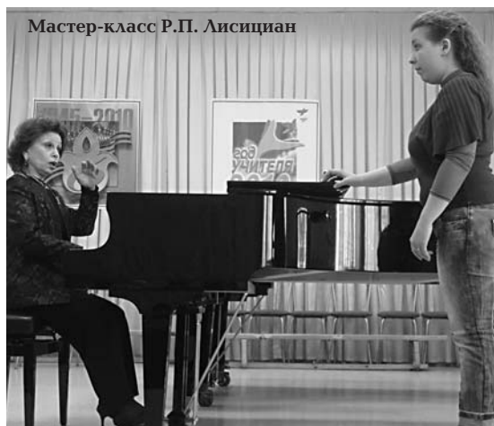
Мастер-класс Р.П. Лисициан