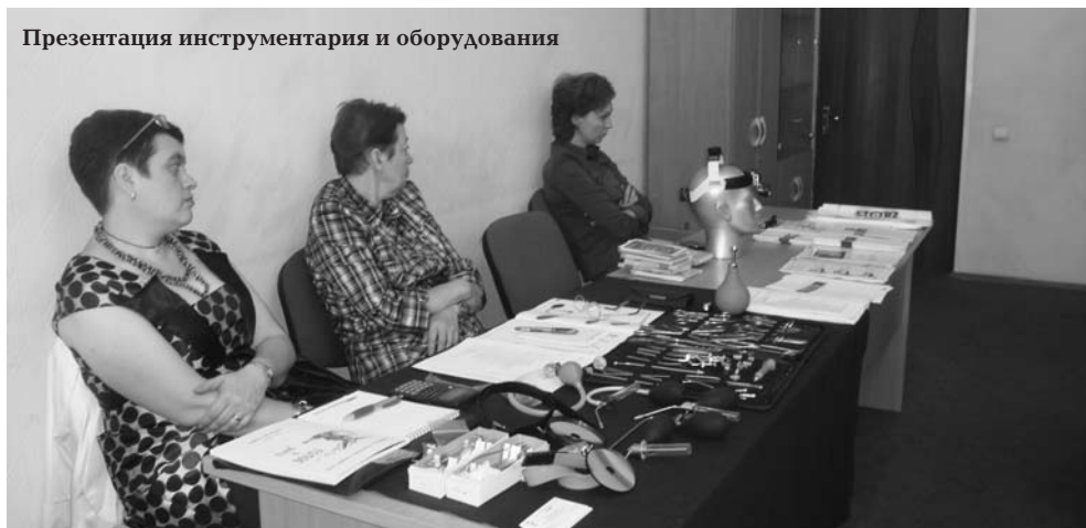
Презентация инструментария и оборудования

Данное мероприятие впервые проходило в подобном формате. Лекции и мастер-классы ведущих специалистов чередовались с 10-минутными презентациями лекарственных средств, применяемых в фониатрической практике. Каждая фирма-участник преподнесла слушателям подарочные наборы с презентуемыми препаратами (Кармолис, Флогэнзим, Инфлюцид и др. препараты DNU, Тантум Верде). Собравшиеся специалисты имели уникальную возможность получить за 2 дня большой объём интереснейшего теоретического материала.